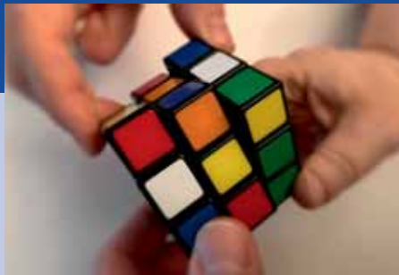
Gute Ideen und beste Praxis

3. Mai 2017 Evangelische Akademie Bad Boll